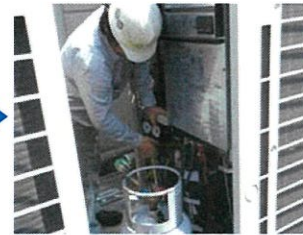
真空引き、冷媒再充填、試運転